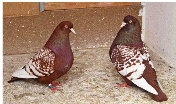
Obrázok 3 - Harmonický chovný pár červených šupinatých bielohtotých rysov