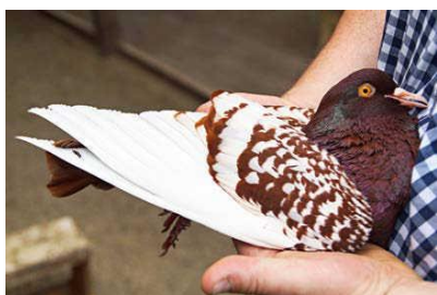
Obrázok 5 - Na tomto červenom špinatom rysovi môžeme vidieť rovnomernú špinatosť a intenzívnu farbu

posledných desiatich rokoch sa toho dosiahlo veľa. Koniec koncov, človek musí byť schopný jednoznačne a bez pochybností identifikovať holuba ako rysa podľa jeho siluety bez hlavy. Ak je správna, zámena so štraserom alebo dokonca mondénom je úplne vylúčená.