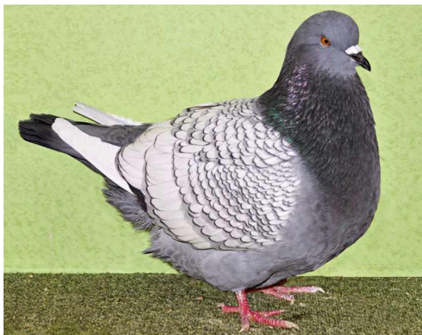
Obrázok 1 - 1,0 Rys, modrý šupinatý, bielošrotý, HSS Neudrossenfeld 2018, v EC (Rudolf Plendl, Eichendorf) FOTO: BECKMEIER

Predpoklady pre zaradenie rýsa do Červeného zoznamu sú nepochybne dané. Treba však pripustiť, že na začiatku 20. storočia boli rýsy skôr podlhovastým plemenom ako silné v postave. Boli to dobrí letci a tak bez problémov našli veľkú časť potravy na poliach. To bol nevyhnutný predpoklad k tomu, aby boli považované za úžitkových holubov. Zaujímavosťou je, že tento typ rýsa sa zachoval v Poľsku ako nezávislé plemeno, resp. variant. Tento variant (už uznané