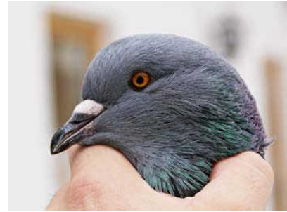
Obrázok 13 - Harmonický tvar hlavy modrého šupinatého rysa

Samozrejme, pri pohľade na každé pero šupinatosti samostatne. Ale aj celý systém šupinatosti musí sedieť. To znamená rovnomerne rozmiestnený a usporiadaný po celom štíte krídla. V prípade holubic je možné vidieť viac základnej farby v štítoch ako pri samcoch. Tu môžeme takmer hovoriť o určitom „charaktere farby“. Skúsený chovateľ vie už na základe šupinatosti štítov určiť, či ide o holuba alebo holubicu.