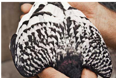
Obrázok 11 - Rovnomerne rozložená šupinatosť mladého čierneho šupinatého rysa z hniezda

Modré šupinaté bielohroté je farebný ráz par excellence. Takmer sa stal synonymom pre toto plemeno. To, čo sa tu dosiahlo v šupinatosti, si zaslúži najvyššie uznanie. Ovály šupinatosti sú veľké a majú čistú bielu farbu. Hrdza a „korenie“ (výskyt farebných bodov v bielom poli pera - český výraz „zapeření“, pozn. prekladateľ) sú odsudzované. Tu je zaujímavé vedieť, že väčšina