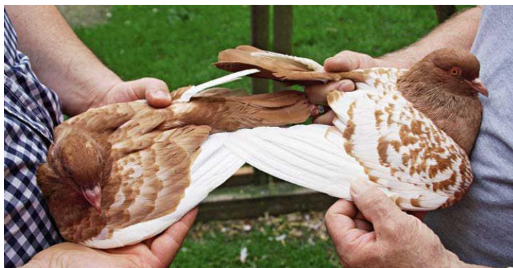
Obrázok 8 - Žltá šupinatost' u mladého (vľavo) a dospelého (vpravo) rasy

Dlhší čas bola chýlostivým bodom farba očí. Oranžová až červená dúhovka by nemala smerovať k žltej. Jemná obočnica okolo oka je nutnosťou. Viac-menej je farebne prispôbená okolitej farbe peria. Len pri červených má byť svetlá, ale vzhľadom na jej jemnosť to nie je významné. Pri čiernych je potrebné byť trochu tolerantnejší najmä pri starších zvieratách. Koniec koncov, nejde o plemeno farbistých holubov, aj keď prispôbená farba obočnice vyzerá príjemnejšie a vyrovnanosť holuba je, samozrejme, preferovaná.