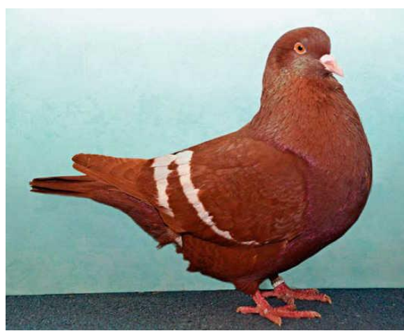
Obrázok 7 - 1,0 Rys, červený bielopásavý, farebnohrotý, HSS Neudrossenfeld 2017, v EB (Peter Bretall, Lützen)