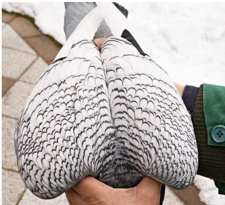
Obrázok 9 - Toto by ste chceli mať v krdli - prvotriedna šupinatost' modrého šupinatého bielohtotého rasy