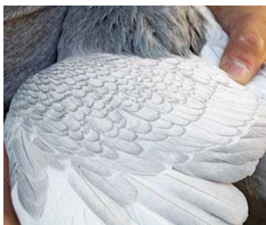
Obrázok 12 - Šupinatosť takzvaného strieborného šupinatého rysa (niekedy sa vystavuje v triede AOC)

zvierat dnes opúšťa hniezdo s takmer čistou bielou šupinatosťou. Pred rokmi ste mohli vidieť zosilnenú hrdzu, ktorá zmizla až s prvým preperením. Okrem čistoty šupinatosti musí byť lem šupiny intenzívnej čiernej farby a predovšetkým presne ohraničený.