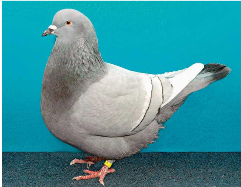
Obrázok 2 - 0,1 Rys, modrý pásavý, bielohtotý, HSS Neudrossenfeld 2012, v LB (Ludwig Schedl, Wurz)

šupinatost'ou. Boli predstavené ako veľmi užitkové a letuschopné plemeno, čo sa dalo ľahko potvrdiť ich vzhľadom. Ak by ste chceli nájsť podobnú pozíciu tohto plemena k rysom pri iných plemenách, potom by ste pravdepodobne videli paralelu pri moravských pštrosch v porovnaní so štrasermi, alebo pri staroorientálnych sovkách v porovnaní s orientálnymi sovkami – porovnanie pôvodného variantu plemena, z ktorého sa časom vyvinulo nové plemeno. Nie je na mieste rozhodovať o tom, či prvý (rys) alebo druhý