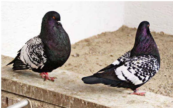
Obrázok 4 - Farebnohroté čierne šupinaté sú zriedka atraktívne

Prirodzene, pri rysoch je medzi plemennými znakmi v popredí tvar holuba. Uvedené platí, aj keď je človek niekedy v pokušení farbu a kresbu – rovnako ako pri farbistých holuboch - zaradiť ešte vyššie. Správny tvar je alfou a omegou holubov rysov. A je to práve tvar, kde chovatelia najviac pokročili vo vytváraní jednotného vzhľadu naprieč rôznymi farebnými rázmi. Najmä v